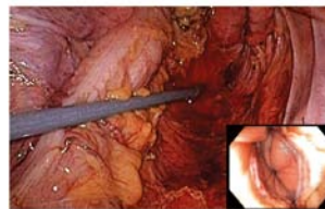
Picture out Picture