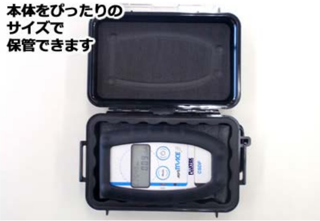
本体をぴったりサイズの サイズで 保管できます