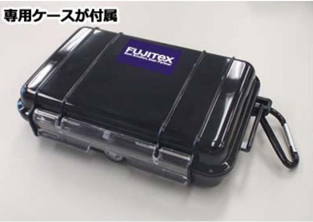
専用ケースが付属