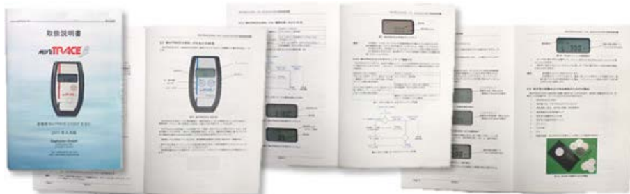
26ページの日本語マニュアルをお付けします