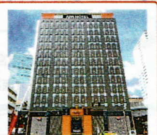
TKPガーデンシティ仙台駅北 宮城県仙台市宮城野区名掛丁201-1 アパホテル(TKP仙台駅北) 2F