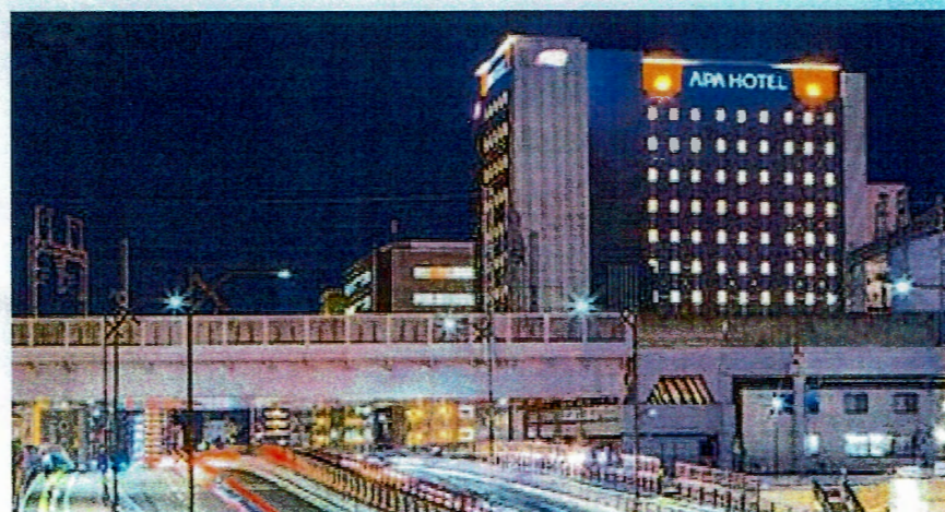
TKPガーデンシティ仙台駅北 ANNEX 宮城県仙台市宮城野区名掛丁201-2 TKP仙台駅北ビル 2F/3F/4F/5F/6F/7F

JR東北本線 仙台駅 徒歩5分 仙台駅北部名掛丁自由通路直結 仙台市地下鉄南北線 仙台(地下鉄)駅 北8出口 徒歩4分 仙台市地下鉄東西線 仙台(地下鉄)駅 北8出口 徒歩4分